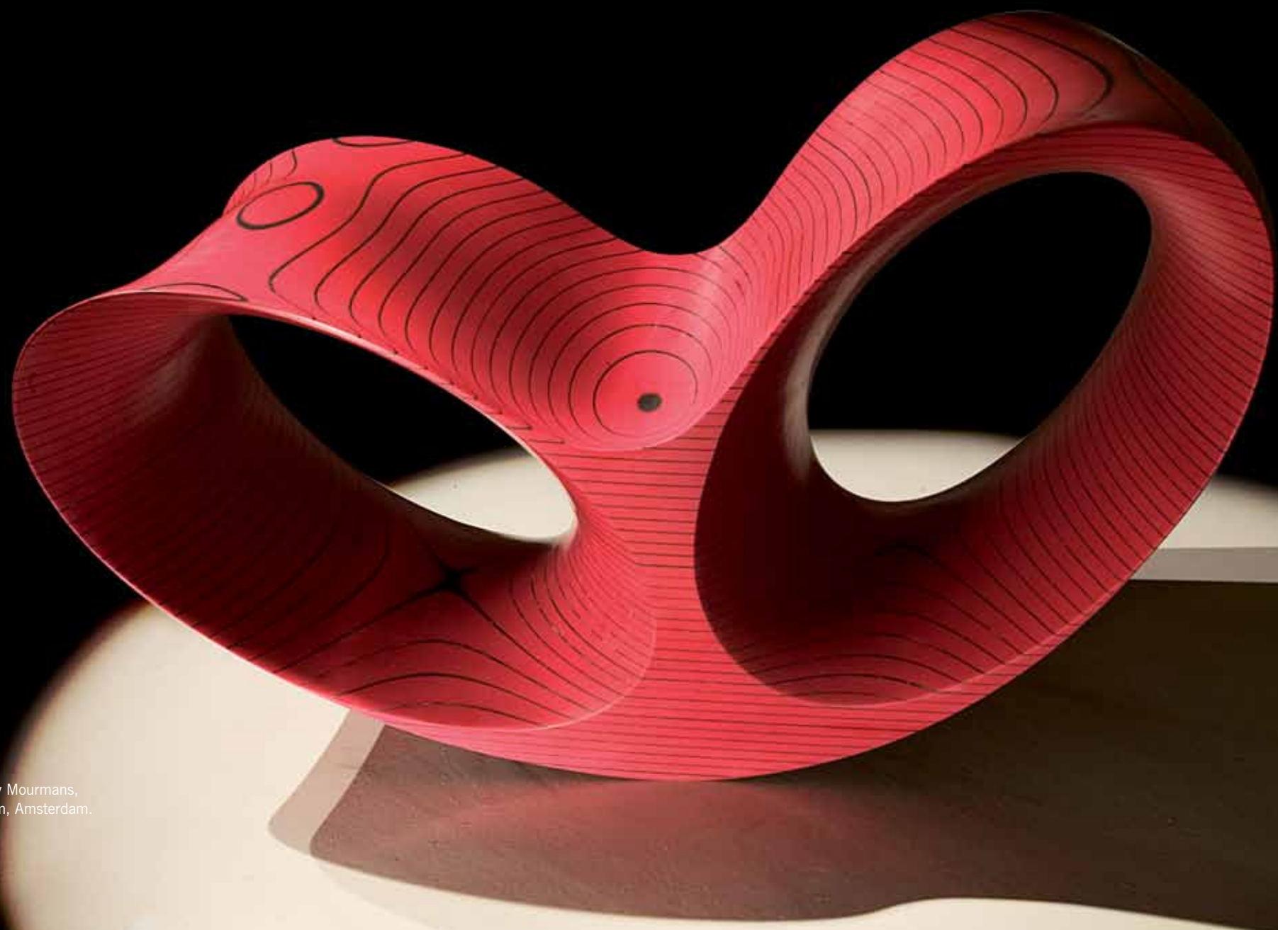
Oh Void 2, 2004, corian, 6 exemplaren, The Gallery Mourmans, collectie Stedelijk Museum, Amsterdam.

Op de beurs in Milaan raakte Arad in gesprek met Vitra-directeur Fehlbaum, die hem vroeg een stoel te ontwerpen. Het werd een opzienbarende fauteuil uit vier platen verenstaal die door bouten met vleugelmoeren bij elkaar werden gehouden, de Well Tempered