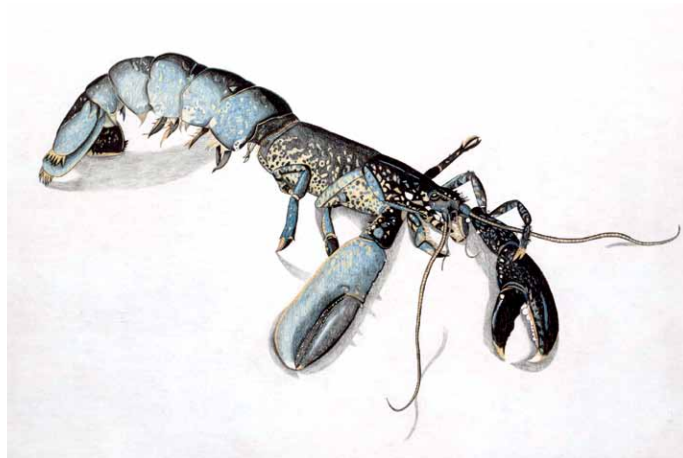
boven 'Lobster', ca. 1944. Krijt op papier, 65 x 83 cm. Particulier collectie, © de kunstenaar.

musea in het buitenland te zien. Er was een nieuwe periode aangebroken. De kunstenaar stortte zich met grote passie op het schilderen van grote naakten waarmee hij zijn roem als realistisch schilder definitief zou vestigen. Zijn manier van werken was heel intens geworden. Nooit werkt hij meer op een vaste plek in zijn atelier, hij